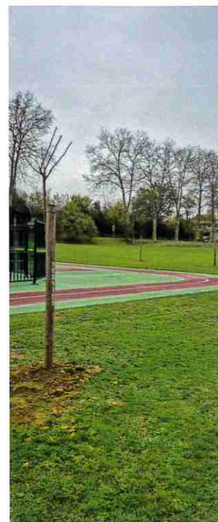
■ Plantations autour du City Stade