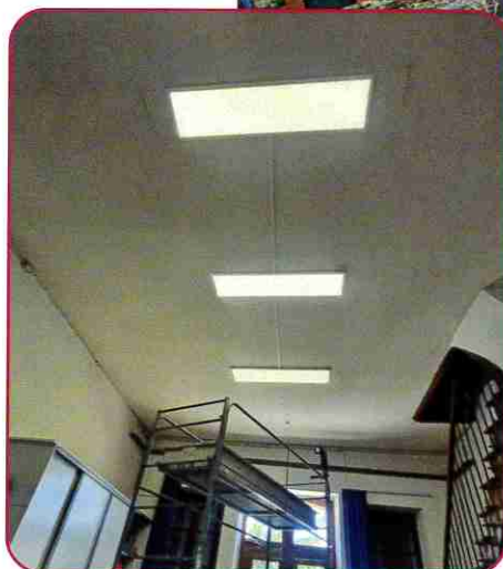
■ Placard dans une classe et éclairage dans la garderie