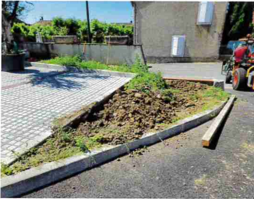
■ Aménagement de la Place du 19 Mars 1962