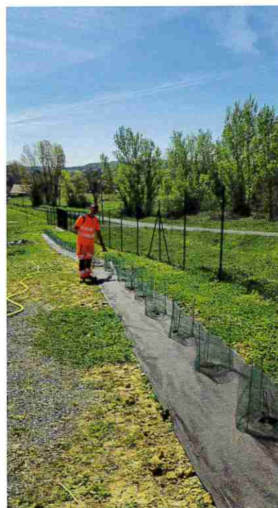
■ Plantation de haies à la station d'épuration