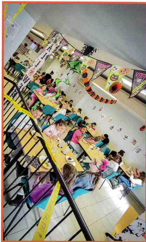
■ Halloween à la cantine

Ce reportage a mis en lumière ce bel exemple de lien intergénérationnel à Serviès entre notre Ehpad et notre école.